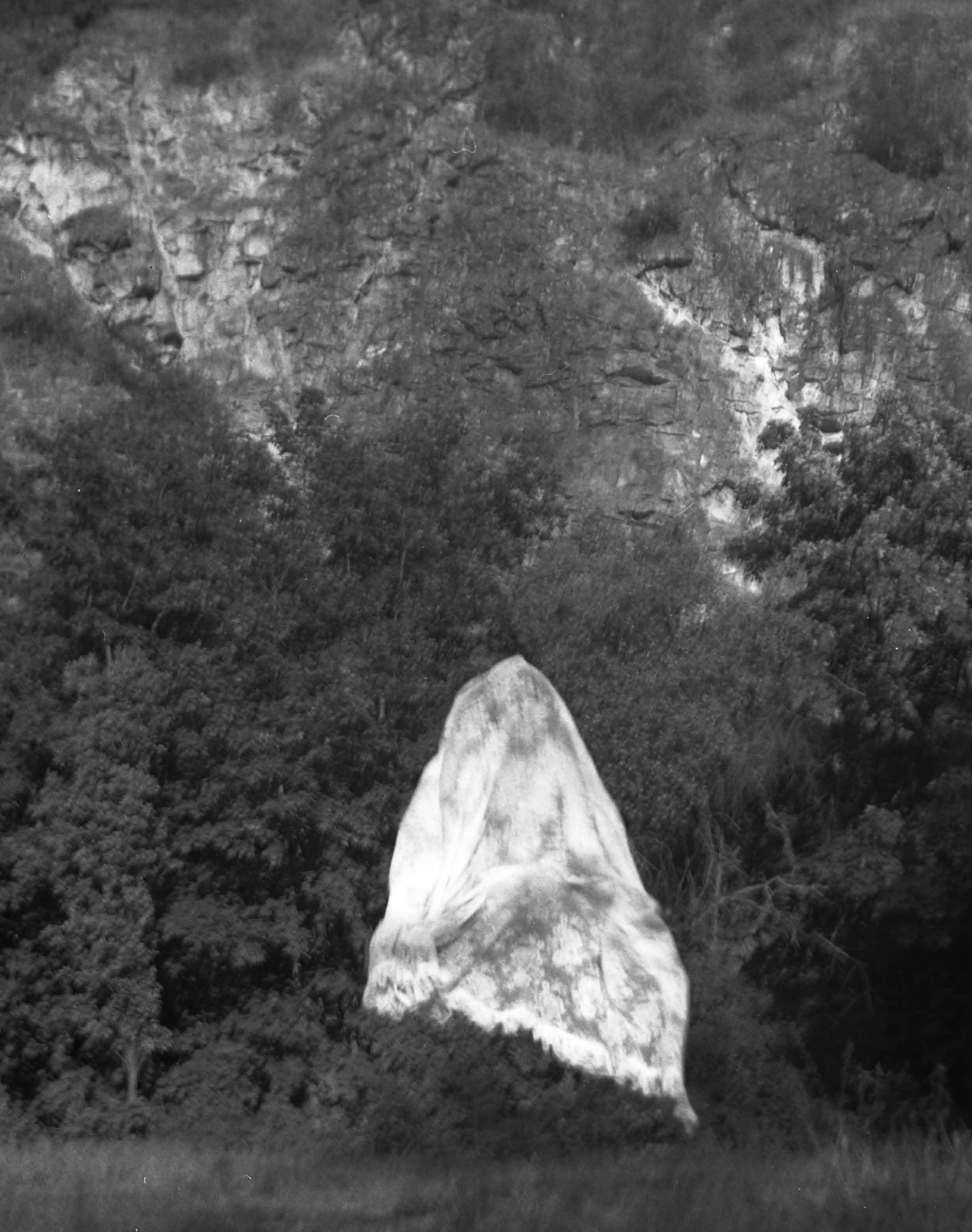
Galerie Díra s přidruženou fotokomorou Katalog k výstavě Dva námořníci hledali loď a ztratili vodu